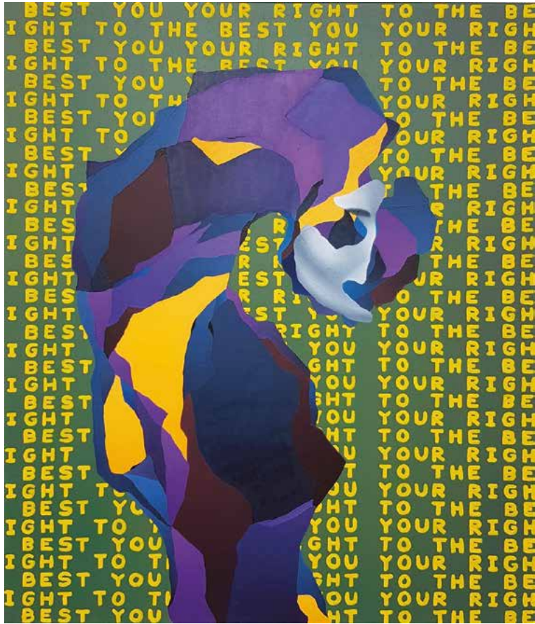
your right to the best you

2021 Öl auf Leinwand 140 x 120 cm 3.100,- Euro