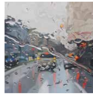
Schwabing 50x50 cm, Öl auf Leinwand 2021 3300 EUR