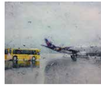
Healing 100x120 cm, Öl auf Leinwand 2014 6545 EUR

Geschäftsführerin Kunstkonnex Artconsulting sl@kunstkonnex.com