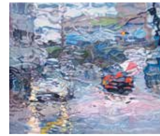
Busan II 54x60 cm Öl auf Leinwand 2018 3800 EUR