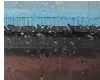
Nizza 80x100 cm, Öl auf Leinwand 2015/2021 4760 EUR