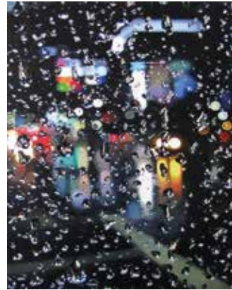
In der Nacht 80x60 cm, Öl auf Leinwand 2020 4200 EUR