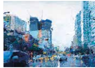
Stadt 100x140 cm, Öl auf Leinwand 2018 7140 EUR