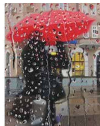
Roter Regenschirm 50x40 cm, Öl auf Leinwand, 2021 3000 EUR