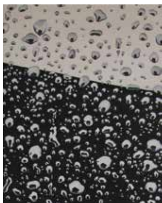
Schwarzer Regenschirm 50x40 cm, Öl auf Leinwand 2021 2670 EUR