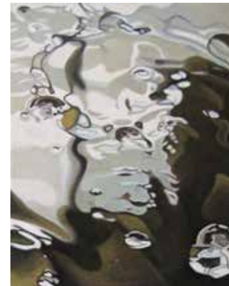
Tropfen Gold 40x30 cm, Öl auf Leinwand 2021 2000 EUR