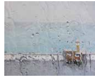
Niça 80x100 cm, Öl auf Leinwand 2014 4760 EUR