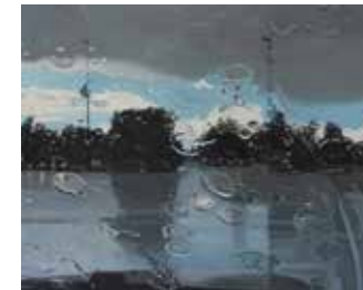
Licht 60x80 cm, Öl auf Leinwand 2016 4200 EUR