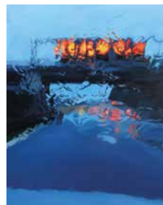
Rotlicht an der blauen Brücke 100x80 cm, Öl auf Leinwand 2017 5000 EUR