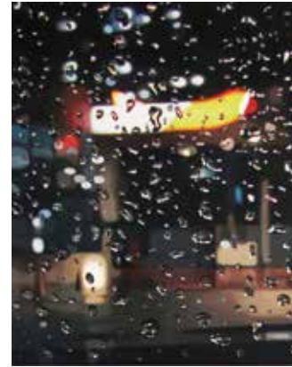
Tankstelle 50x40 cm, Öl auf Leinwand 2021 3000 EUR