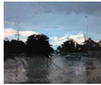
Im Auto 90x110 cm, Öl auf Leinwand 2014 5950 EUR