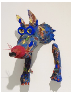
Town Resident, 2016 48 x 27 x 41 cm, painted wood