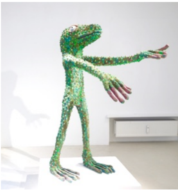
Hello, You There!, 2012 166 x 68 x 119 cm painted wood