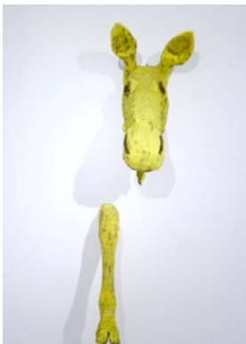
Yellow Hallucination II, 2012 195 x 78 x 55 cm, painted wood