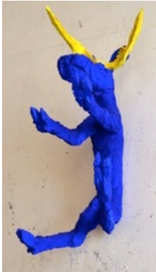
Gold Horn, 2014 81 x 29 x 38 cm painted wood