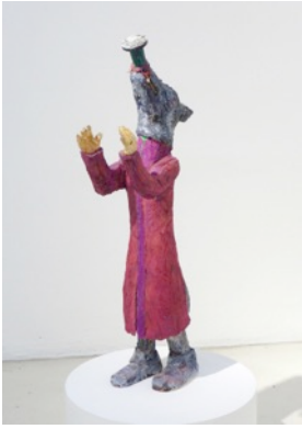
Pope's Nightmare, H 108 cm, painted wood