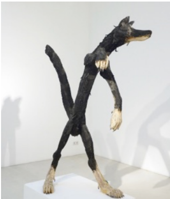
What's going on, 2015 painted wood, H 215 cm, 2015