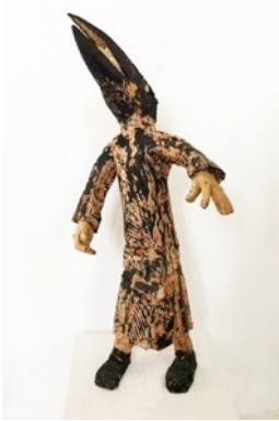
Cry, 2016 H 80 cm, painted wood