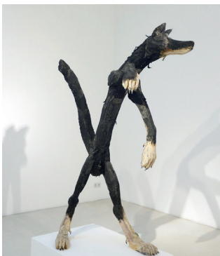
Veikko Hirvimäki What's going on

„Ihmisessä itsessän piilevät pisimmät matkat“ 2 – „im Menschen selbst sind die längsten Reisen verborgen“: Diese Erkenntnis des finnischen Schriftstellers Mika Waltari ist nicht nur namensgebender „Leitgedanke“ des bekanntesten Denkmals 3 Veikko Hirvimäkis, sondern charakterisiert auch sein künstlerisches Œuvre, umfasst dieses doch von Malerei über Arbeiten in Bronze und Stein bis hin zu Skulpturen aus Holz eine Vielfalt, die von einer langen Reise zu sich selbst erzählt. Geboren 1941 im mittelfinnischen Petäjävesi als Sohn eines Landwirtes, entschied sich Hirvimäki zunächst für eine Ausbildung im Bauwesen an der staatlichen Berufsschule. 4 Bereits damals jedoch belegte er künstlerische Abendkurse an der örtlichen Volkshochschule und malte Aktstudien im Künstlerverein Jyväskylä, den er im Alter von 19 Jahren auf einer Ausstellung in Helsinki repräsentieren durfte. Kurz darauf zementierte er den Entschluss, sein Leben gänzlich der Kunst zu widmen, mit dem Bau eines Ateliers in seinem Geburtsort. 5